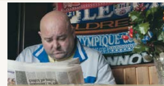
NEBEN DEN GLEISEN

Den Spielplan findet ihr im entsprechenden Programmflyer in unseren Kinos.