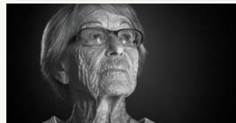
EIN DEUTSCHES LEBEN

Dokfilm, DE 2017, 99' Regie: Irene Langemann NEU ab 30.03., läuft bis 26.04.