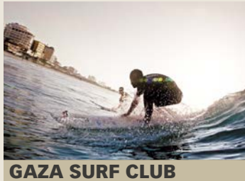
GAZA SURF CLUB